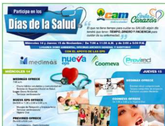
Imagen No. 3: Póster invitación Día de la Salud 2018.

A cabo la actividad “Días de la Salud” en las instalaciones de la CAM los días 14 y 15 de noviembre de 2019, en donde se ofrecieron diferentes programas de promoción y prevención.