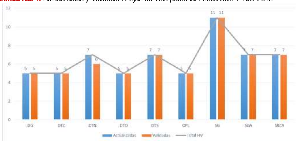
Gráfico No. 1: Actualización y Validación Hojas de Vida personal Planta SIGEP Nov 2018

de Dirección, se logró a noviembre obtener un 100% de actualización y validación de las hojas de vida del personal de planta en el sistema, como se muestra: