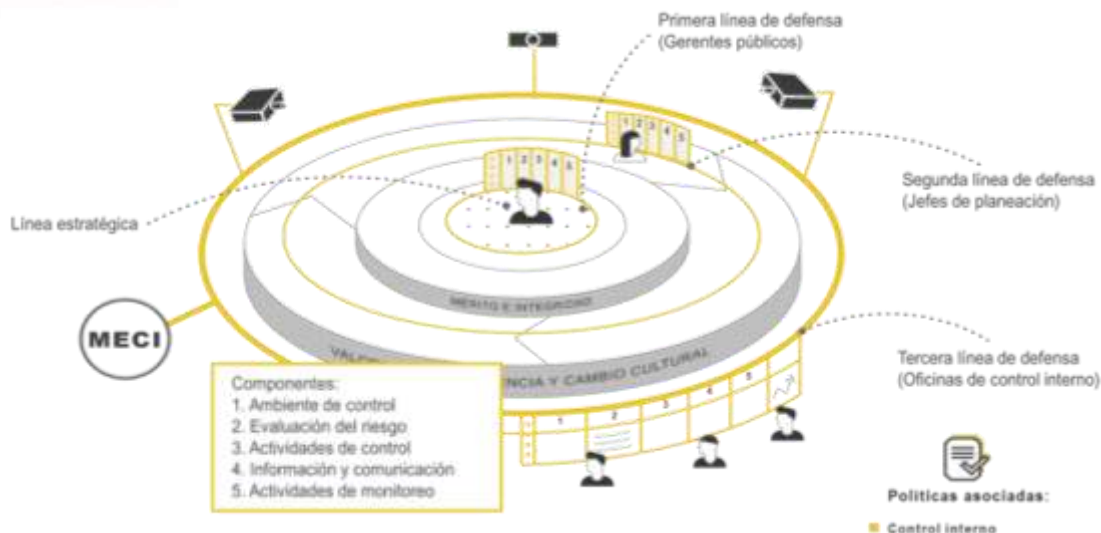
Imagen No. 1. Séptima Dimensión MIPG – Control Interno