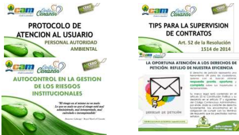
Imagen No. 2: Imágenes presentaciones Cultura del Autocontrol – Equipo MECI 2018

Por otra parte, la Asesora de Dirección y el equipo MECI realizaron mes a mes, diferentes actividades de socialización vía mail con el fin de promover la cultura del autocontrol institucional, permitiendo que los funcionarios lleven a cabo sus funciones bajo atributos de calidad y en busca de la mejora y la excelencia: