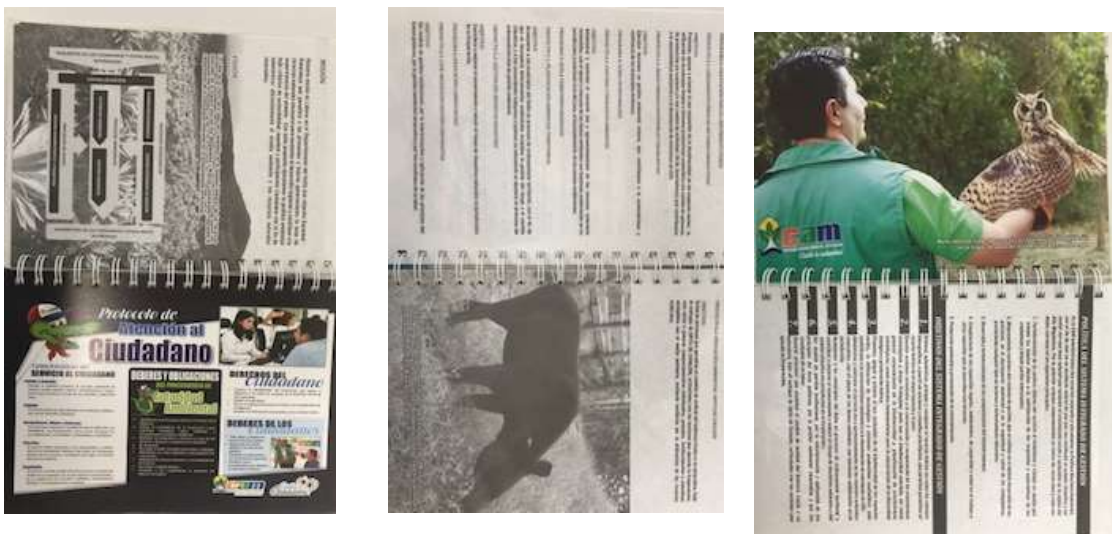
Imagen 1. Fotografías Agenda Institucional 2018

Otro de los canales importantes para la difusión de información institucional es la Intranet Corporativa. Debido a los múltiples inconvenientes por la operatividad de la aplicación, se suscribió contrato 152 el 29 de junio 2018 cuyo objeto es: “CONTRATAR EL SUMINISTRO, IMPLEMENTACIÓN Y PUESTA EN FUNCIONAMIENTO DE LA INTRANET CORPORATIVA PARA LA CAM”. Como medida de contingencia entre tanto se ejecuta el precitado contrato, el SIG pone a disposición de todo el personal una carpeta compartida en: https://drive.google.com/drive/folders/1C-iHFsfmR1DAhzkmOrFhNbjUiu-SiR_P .