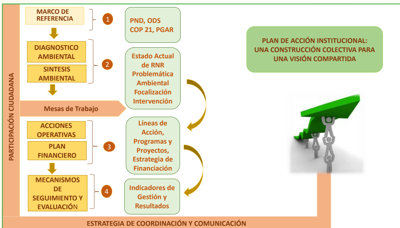
GRAFICO No. 3: ENFOQUE METODOLÓGICO