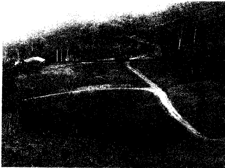
Fotografía No1. Lugar en el cual se ubica la casa de habitación y la reserva lugar en el cual se realiza la derivación del agua.

Para llegar al punto de captación sobre la parte alta de la vivienda se observa una reserva la cual se encuentra a 70 metros, ingresando se llega al lugar en el cual encontramos cuatro Nacimientos que conforma la fuente hídrica NN lugar en el cual se realiza la derivación del recurso hídrico.